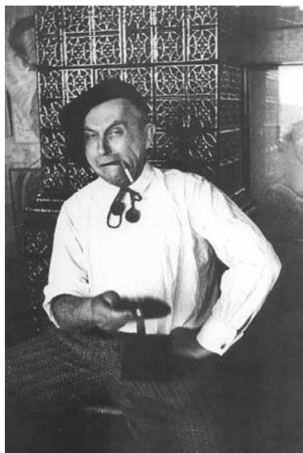
Witkacy w niewyprasowanej koszuli. (marzec 1934)

zmienianie ubrań. Ale jeśli ktoś na to nie ma, może przedłużyć czas zmiany za cenę pewnej pracy nad czystością ciała 29 .