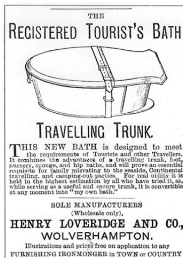
Reklama podróznego tubu

Podobnie było w większości krajów europejskich. Zmiany wymusił postęp cywilizacyjny, któremu początek dały Stany Zjednoczone. Budowa wodociągów i kanalizacji w większych miastach umożliwiła architektom projektowanie domów wyposażonych w podstawowe urządzenia sanitarne: