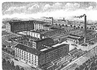
Fabryka Braci Sennewaldt w Białej Krakowskiej