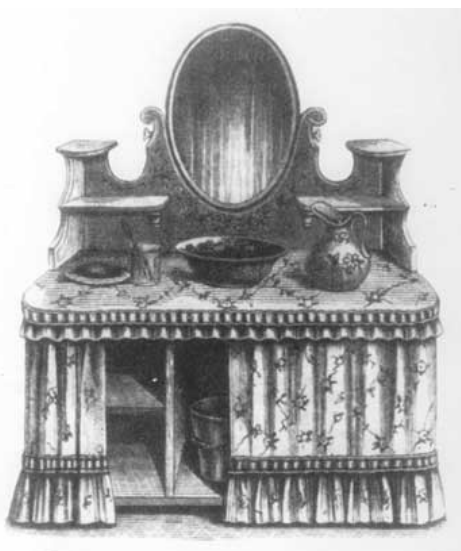
Elegancka umywalnia z kompletem naczyń do mycia

jestem za wanną co tydzień, a za myciem się „na cało” mydłem i ewentualnie szczotką Sennebalda z Białej co dzień. Ale jak ktoś mi powie, że nie był nigdy w łaźni, a jest w dodatku już po czterdziestce, to naprawdę w mordę bym prał niechlują dla jego dobra do krwi – dodaję; niechlują raczej we- niż zewnętrznego. Bo łaźnia to jest tak jak mycie się szczotką od wewnątrz, szorowanie organów wewnętrznych, ścięgien, stawów, mięśni, nerwów, po prostu samych komórek. [...] Wszystkie świństwa wychodzą z człowieka razem z potem – wszystkie organy zaczynają żyć na nowo, przemiana materii staje się prawidłowa, usuwają się wszystkie złogi kwasów i spowodowane przez nie artretyczne zgrubienia członków 7 .